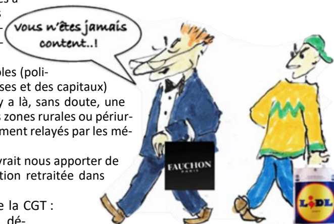
Renforcement des inégalités en France...

Ce baromètre annuel justifie pleinement les revendications de la CGT : SMIC et retraite minimale à 2 000€, augmentation des salaires, développement des services publics, Sécurité sociale intégrale, etc.