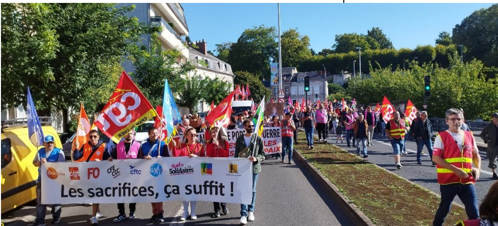
Manifestation du 10 septembre 2025 à Bourges